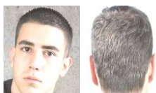
CORTE REGLAMENTARIO PARA LOS VARONES

NOTA: No se permiten el uso de botas a menos que sea por prescripción médica (ortopédica)