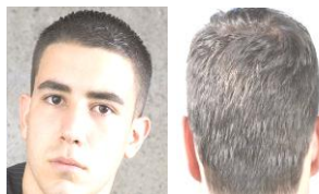
CORTE REGLAMENTARIO PARA LOS VARONES

NOTA: No se permiten el uso de botas a menos que sea por prescripción médica (ortopédica)