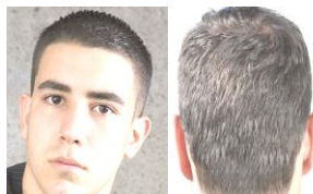
CORTE REGLAMENTARIO PARA LOS VARONES

NOTA: No se permiten el uso de botas a menos que sea por prescripción médica (ortopédica)